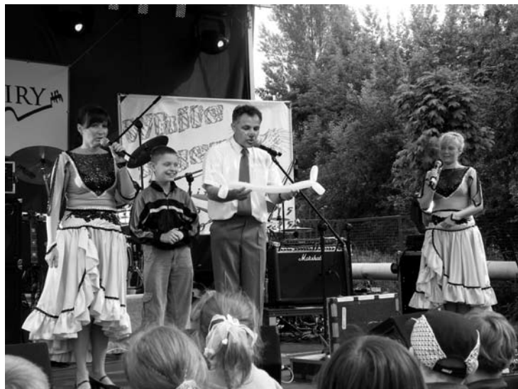
Fot: Program dla najmłodszych uczestników Festynu.

TAKIEJ PUBLICZNOŚCI NIE MA NIGDZIE. LUDZIE, BYLIŚCIE REWELACYJNI I STWORZYLIŚCIE NIE ZAPOMNIANĄ ATMOSFERĘ. TO WYDARZENIE BĘDZIEMY PAMIĘTAĆ DŁUGO. DLA TAKICH LUDZI WARTO BYŁY TE CAŁE PRZYGOTOWANIA I MASA PRÓB.