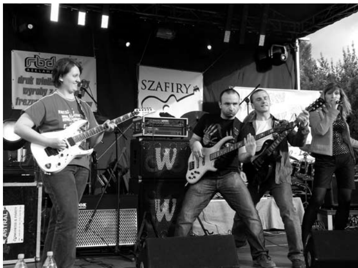
Fot: WhiteTiger grali świetnie.

Gratuluję wspaniałego koncertu i serdecznie dziękuję nie tylko za tę łzę kręcącą się w oku. Pozdrawiam Wszystkich. Piotr Zawistowski