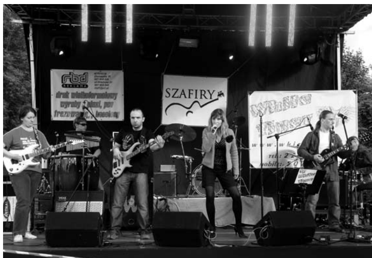
Fot: WhiteTiger raz jeszcze.