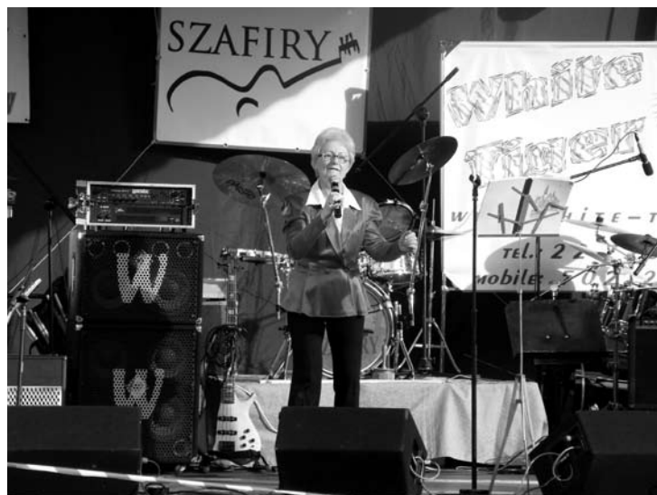
Fot: Elaband rozgrzewa publiczność największymi przebojami.