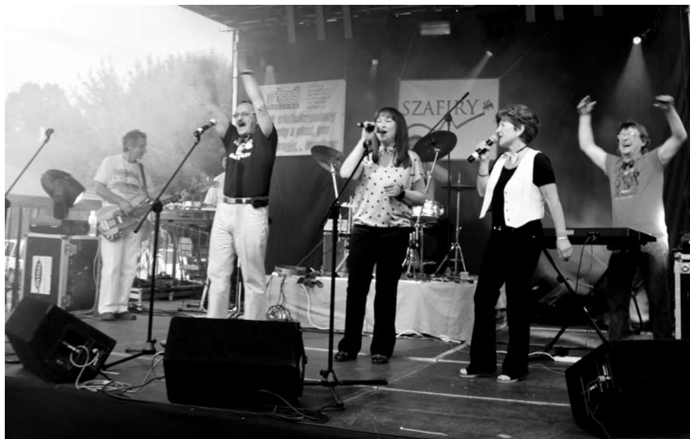
Fot: Szafiry - gwiazdy Festynu.

Gratuluje Zbyszku!!! to dobra robota, bo dopięłeś celu i wykończenie bez zarzutu, jak z postów na forum się dowiaduję. Gratuluje zresztą całemu zespołowi SZAFIRY!, choć nie wiem – kto grał?, kto śpiewał?